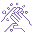
ວຽກງານສຸຂາພາໄມ

ໂຄງການຈະໃຫ້ຄວາມຊ່ວຍເຫຼືອໃນການສ້າງ ມາດຕະຖານດ້ານສຸຂາພາໄມ ແລະ ການປ້ອງກັນການຕິດເຊື້ອພະຍາດ COVID-19 ແລະ ຊ່ວຍເຫຼືອຄູ່ຮ່ວມຈັດຕັ້ງປະຕິບັດໂຄງການ ແລະ ຈຸນລະວິສາຫະກິດ, ວິສາຫະກິດຂະໜາດນ້ອຍ ແລະ ກາງໃນອຸດສາຫະກຳທ່ອງທ່ຽວປະຕິບັດຕາມມາດຕະຖານທີ່ຖືກສ້າງຂຶ້ນ.