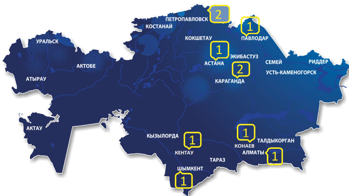
Рисунок 1.: Карта объектов по утилизации отходов пластиковой упаковки

На основе данных по размещению объектов переработки отходов пластика составлена карта (рисунок 1.)